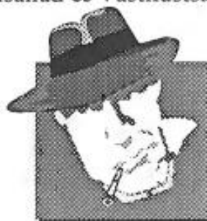
Il Duce Bogart har återkommit...