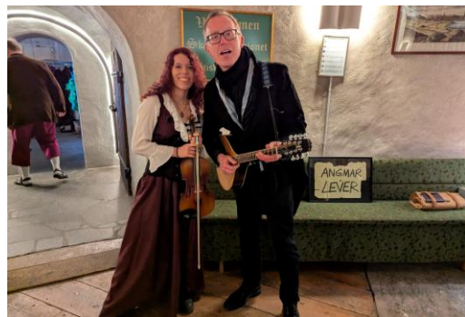
Glimmer i borgen. Och Angmar lever!