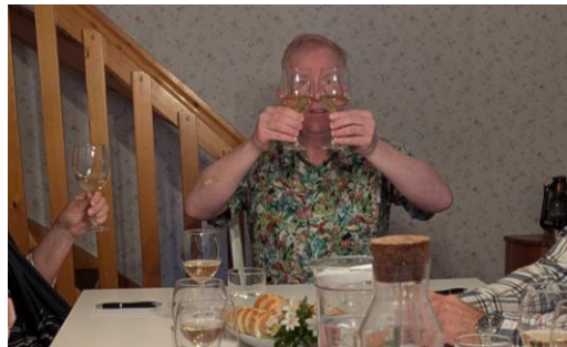
Regentens beteende med gyllene dryck.

Deras beteende kommer att studeras i detalj av hobbitgillet och betygsätas enligt en så komplicerad matris att det kommer att krävas flera besök på Den gyllene abborren för att uttydas. Mithlonds inbyggare uppmanas härmed att varsko hobbitgillet när de anser att någon av de gyllene kandidaterna uppträder hobbitiskt, då det kan underlätta vårt beslut i denna komplicerade men ack så viktiga fråga.