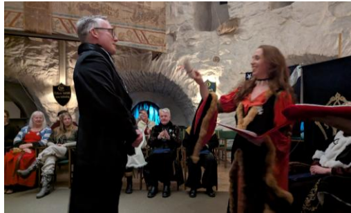
Roac Mithlonds Ringbärare.

Under nyårsfesten delades ett antal årsstenar ut. Amarië, Helm och Silmariën fick en snöflingeobsidian (1-årssten), Smaug fick en sodalit (2-årssten), Hjortrongull fick en svart onyx (4-årssten), Azruzagar, Wilwarin, Tindomiël, Nenwen och Withywindle fick en karneol (11-årssten), Ruby fick en malakit (22-årssten), och Vardamir fick en ametist (29-årssten).