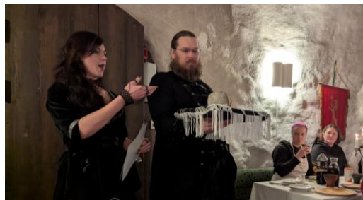
Kånkastenen i gatustensgrått.

Efter Lotsens årsstenar, Musikgillet's framträdanden, Kånkastens återuppståndelse (Bele-wien förädrades denna MMM:ska trofé) och kökets eglerio vidtog invigning av Dáin i den stämmingsfulla ordenssalen. Därefter var det dags att bära upp alla bord och stolar och återställa borgen i dess ursprungliga skick. Återigen har vi grundligt firat Saurons fall!