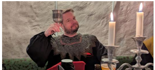
Vi ses i Nang... i Bokskogen.