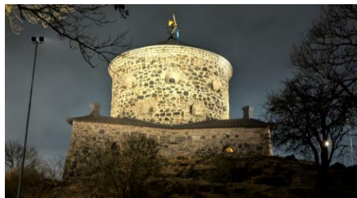
Skansen Westgötha Leijon.