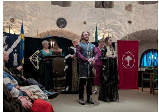
Helm och Silmariën i ordenssalen. Eglerio!

Begivenheten började så smått runt lunchtid med att de då församlade hjälpredorna i sann krakowsk anda fick mota bort hotande danskar som ämnade tränga in i borgen (turister, alltså). Bord och stolar bars ned för den mycket branta trappan för att bänka allt mithlondrim, som efter påtagande av midgårdade dräkt klättrade upp för sagda trappa, och en till, för att i Götiska Förbundets pampiga ordenssal högst upp i skansen avhålla de midgårdade ceremonierna. En rådsmedlem avtackades och en ny svors in och inbyggare upphöjdes inom ordnarna.