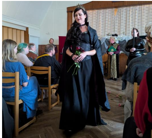
Den nydubbades egerio och burzum-ûk!

Under banketten kände MMM marken skälva under fötterna – Dam Cimnolwë tog charmant över gillesmästarskapet utan alltför stora förluster. Nåja, inga som räknas i alla fall.