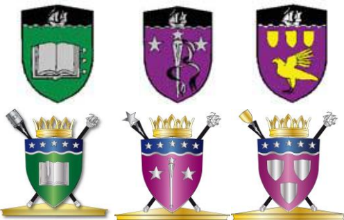
Arkivarien, Ceremonimästaren, Heraldikern.

Efter Varberg är det först i ET nr 78 (2006 UT) som heraldik nämns igen, i en artikel om ämbeten och poster och deras sköldemärken. Här visas de märken som hänger i våra ämbetskedjor (vilka nu ska rustas upp). Jämfört med sköldemärkena som finns i Vapenboken skiljer sig de som tillhör Arkivarien, Ceremonimästaren och Heraldikern något men alla övriga är likadana: