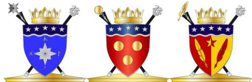
Lotsen, Skattmästaren, Skrivaren.