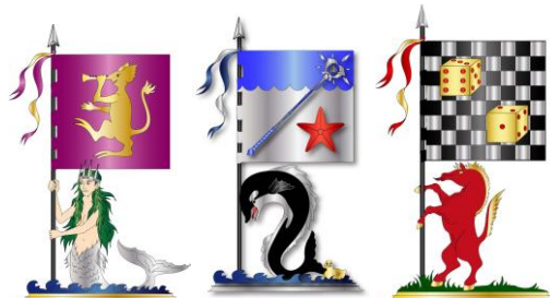
Musikgillet, Nümenorgillet, Spelgillet.