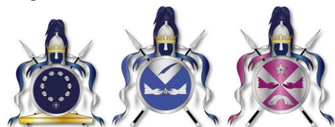
Drotsen, Inrikeskanslern, Utrikeskanslern.

I nästa nummer av ET är det dags att kasta oss över kärnan i den här artikelserien, inbyggarnas personliga vapen och tankarna bakom dem.