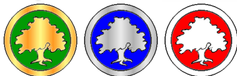
Mithlonds ordnar: fanor på HGXXXV, sköldemärken och loggor.

Efter Varberg är det först i ET nr 78 (2006 UT) som heraldik nämns igen, i en artikel om ämbeten och poster och deras sköldemärken. Här visas de märken som hänger i våra ämbetskedjor (vilka nu ska rustas upp). Jämfört med sköldemärkena som finns i Vapenboken skiljer sig de som tillhör Arkivarien, Ceremonimästaren och Heraldikern något men alla övriga är likadana: