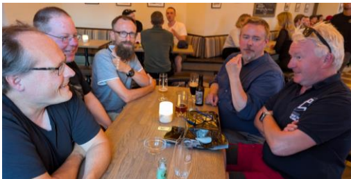
Mithlondpuben rapporterar sig själv.