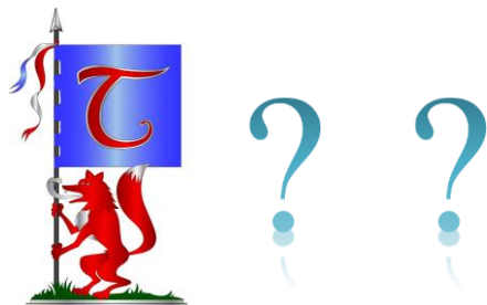
Språkgillet, Författargillet, Äventyrsgillet.

I ET Special nr 1 som utgavs under HGX på Varbergs fästning (2000 UT) nämndes något om heraldik. Väggarna i rikssalen hade prytt med vapensköldarna för Mithlonds ämbeten. Å det väldiga draperiet i gatustensgrått hängde från vänster, Telperions, Mithlonds och Laurelins standar.