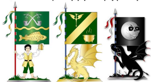
Hobbitgillet, Matgillet, Morgothgillet.