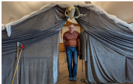
Välkommen, vän, och träd in!

Men jag fångades av musikens drillar och stannade kvar en stund hos musikerna. Låtvalet var utmärkt! Trollbunden ville jag visa Roac och de andra trubadurerna min uppskattning, så jag gick fram till korpen och tackade för den stämningsfulla underhållningen. Då hörde jag en stadig stämma bakom mig utropa: "Rör inte korpen! Han är fridlyst." När Dam Belewien befäller så lyder man!