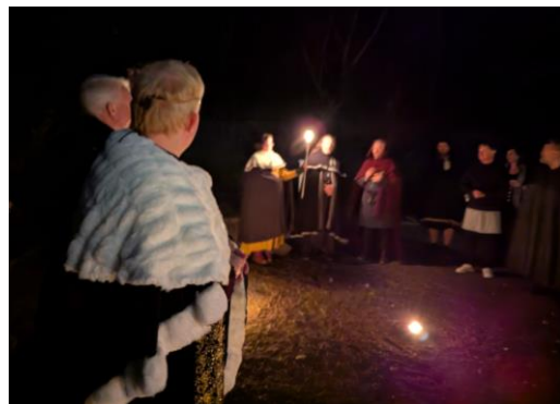
Mörker och ljus under HG-ceremonierna.

Ni minns väl blanketten som Angmar delade ut under sin ambassad? Den där Mithlonditer uppmanades att ansöka om asyl i Angmar – och vi undrar om det inte kan vara så att Mithlonds Regent mycket väl kände till detta tilltag i förväg! Är detta en del av en större plan, i ett syfte som vi blott kan ana men ändå frukta? Vi kräver därför att Regenten är tydlig och lägger alla papper på bordet!