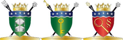
Historikern, Klenodbevararen, Lagvrängaren.