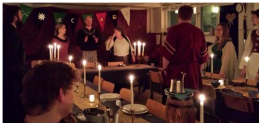
En minnesbild från TF år XXXIII (2014 UT).