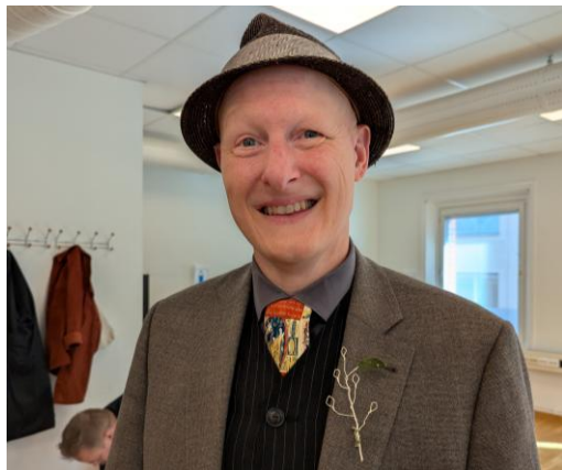
Farbror Fantasy med sin nya kvist.