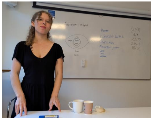
En gnistrande avslutning på Ainulindalë.

Nu ser vi fram emot höstens Ainulindalë, som trots Fredegars hot om att vi måste flytta till Molinsgatan verkar kunna tilldra sig på Haga Östergata 12 alltjämt.