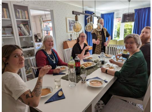
Hemma hos Hjortrongull och Ar-Pharazôn.