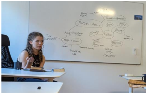
Embla summerar det kulturella läget.