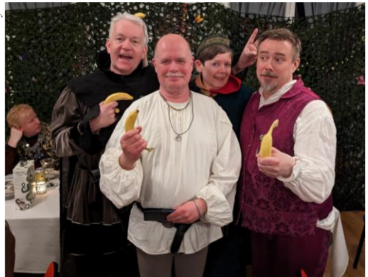
Gamla fyllon och Gwindor vann otippat.

Fest och gamman utbröt och det var äntligen dags för mat, god och närande och i riktiga mängder: Hobbits approve. Resultaten från tipspromenaden redovisades och vinnare blev lag Gamla Fyllon + Gwindor. Kanske namnet gav stilpoäng?