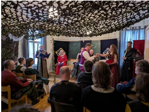
Mithlonds Ringbärare: Nerd of the Rings.

Mithlonds ceremonier hölls inomhus och det svors in rådsmedlemmar och ämbetsmän till höger och vänster: Smaug (Skattmästare), Ar-Pharazôn (Ceremonimästare), Glorfindel (Heraldiker). Fredegar blev återigen Mithlonds Ringbärare, till allmänt jubel.