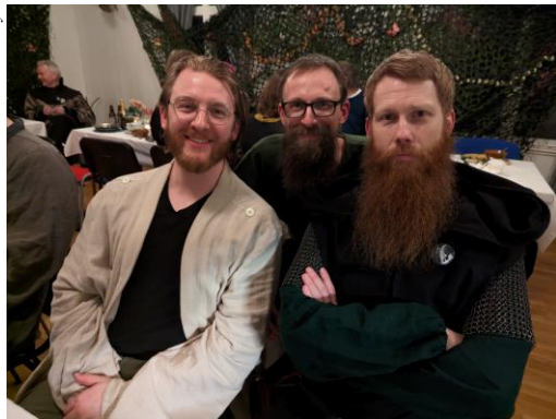
Skäggitet: Rasmus, Glorfindel, Smaug.

Med hjälp av alla Mithlonds kamouflagenät, Nösnässkolans gamla samling av uppstoppade fåglar och 300 miniatyrspindlar gjordes lokalen raskt om till Rhosgobel, Radagasts hemvist i Mörkmården. Förutom att låta oss hålla fest där behövde han vår hjälp att rensa bort de där spindlarna; den som fångade flest vann ett fint