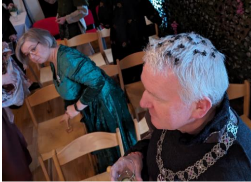
Numenoranskt hattmode modell Äh.

Mithlonds ceremonier hölls inomhus och det svors in rådsmedlemmar och ämbetsmän till höger och vänster: Smaug (Skattmästare), Ar-Pharazôn (Ceremonimästare), Glorfindel (Heraldiker). Fredegar blev återigen Mithlonds Ringbärare, till allmänt jubel.