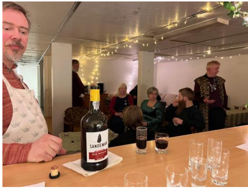
The Professor inom kort!