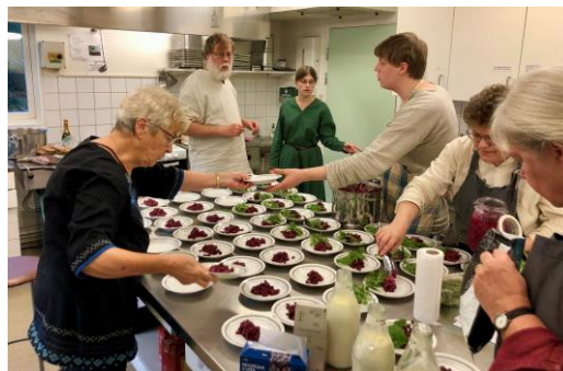
Bankettköket bakom kulisserna

Þör första gång på höstlens gille Þör förning och fägnad förnämlig! framförd Þeslu Baniel, Baldin och alla i köket Dal!