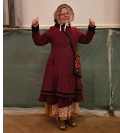
Kram, Saffran!

Inte förrän jag steg innanför tröskeln på Tofta Bygdegård strax norr om Varberg insåg jag hur mycket jag har saknat Mithlond – för det första som hände på HGXXX var en kram!