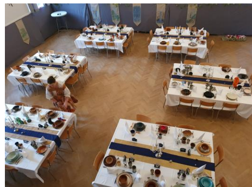
Bankettsalen förbereds

Efter en stund klingade den frejdiga dansen av. Hovkonditor Baranor och konung Turgon tycktes slutligen vara nöjda med sin föreställning. Båda hade tagit sig ur den spända situationen med äran i behåll. Vi andra satt mållösa inför detta dramatiska skådespel och visste inte riktigt om vi skulle ropa högt av förfäran eller jublande applådera de fint koordinerade stridskonsterna. Någon började klappa händerna och snart följde andra gäster dennes exempel. Herrarna med värja såg ut att ta åt sig av det uppskattande bifallet och bugade djupt innan de åter satte sig ned vid sina fulla silverfat och gnistrande dryckesbägare.