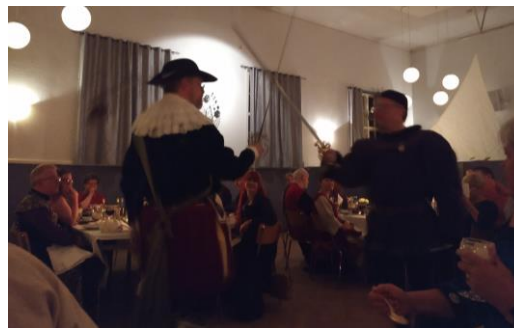
"En representant för Gondorlin!" (Bild: Glorfindel)

hoppade, parerade, skuttade undan, duckade och värjde sig med sådan intensitet att deras tri-kåer stramade över knäna och slitsarna fladdrade på deras svulstiga överarmar.