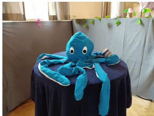
Ett naturligt sjömonster?

Det är intressant att se hur professors tankebanor gick och jag blir inspirerad att läsa om History, 30 år senare.