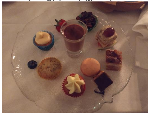
Den andra efterrätten

Vid stranden av havet det skummande gröna Hamnen den ligger så skimrande grå Där dagar och nätter bland alver så sköna Vi lever och frodas och förning fin få Och svanskeppen ses segla vackert vita Och västerns vindar uti seglen slita Kom följ mig till stranden, vi minnes den tiden Kom följ mig till Mithlond, vi minns det ju än