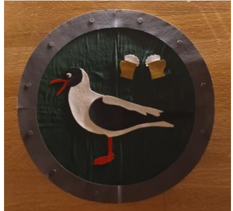
Skrattande Måsen

Lova mig att ni lyssnar på den innan ni läser texten! Melodin är nämligen en helt väsentlig del av den här anrättningen.