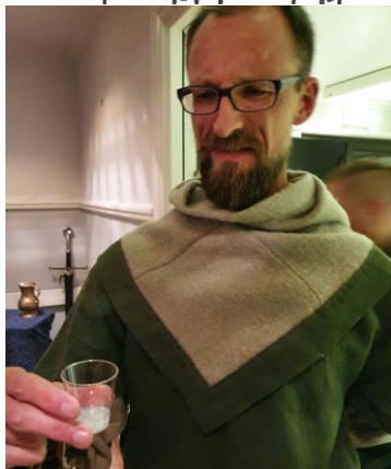
Glorfindels reaktion på Angmars ambassad-gåva – eller Tedds vitsar? (Bild: Ruby)