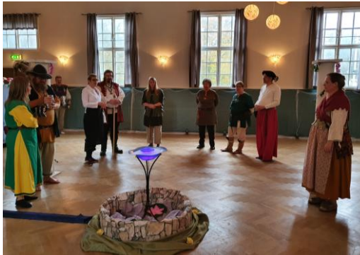
Slottsträdgården förevisas

Lördagen var något hektisk, med fullt bankettstök ”bakom kulisserna”, Fimbrethils femkamp (poängpromenad, svanskeppskväden, kampstationer mm), en ”indoor outdoor finger-buffet”-lunch i slottsträdgården med levande musik, marknad, workshops i form av avancerad dans eller cocktail-lab (kan ej kombineras utan risk för liv och lem) och ett antal föredrag. I galleriet hade Bullen hängt upp en svit med bilder och texter från alla tidigare 29 höstgillen.