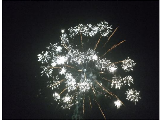
Círdan bjöd på fyrverkerier

Under banketten framfördes de kväden som skapats under Fimbrethils femkamp och som återges här nedan tillsammans med några andra epos. Femkampen vanns av lag Mithlond Mix. De Grå Eminenserna gjorde ett bejublat eller åtminstone något förvirrat kaksläpp, årsstenar delades ut och ett antal skålar höjdes. Eglerio!