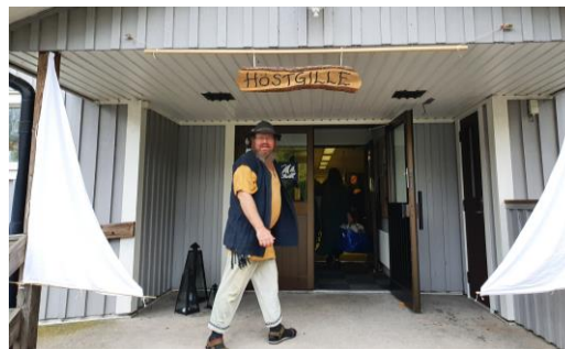
Välkommen till Höstgille XXX!