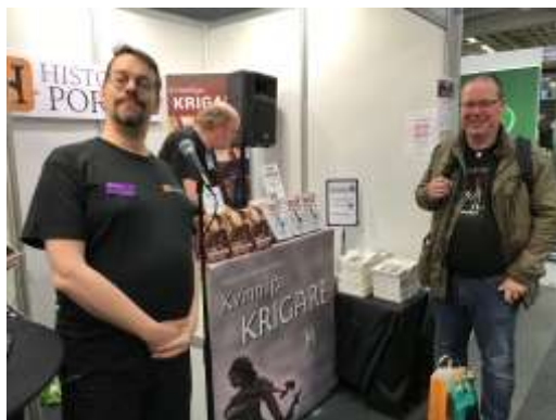
Författaren och hans glada kompis Malbeth