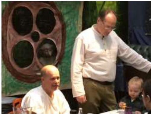
Endast vissa alver är välkomna till Bilbo