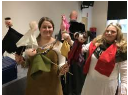
Angmars råd slöt upp mangrant