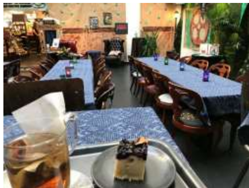
Hobbitkrog mitt i Göteborg