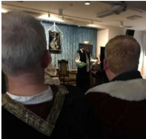
Grå eminenser begrundar tiderna och sederna

Det vankades bildfrågesport av Ren den Orene, hantverkshörna med nålbindning mm samt god och riklig mat. Sist men inte minst fick vi alla sola oss i glansen från Glenn-Kenneth the Mighty!