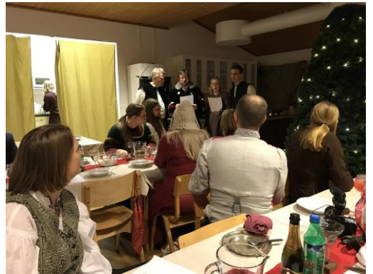
Bidragen kunde även framföras som allsång