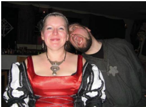
Grå Eminens demonstrerar Mithlonda feedback. (Från ET nr 82.)