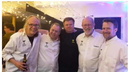
BarBar 27 år

Då invigningen var till ända bar det av till BarBar, där "in i dimman" fick en ny betydelse. Det är tur man är utflyktsjägare, annars är jag inte säker på att jag hittat bardisken.