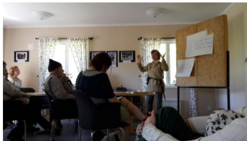
Beregons multimediaföreläsning

Ny dag och givetvis studsade vi alla upp i ottan för att låta smaka av den underbara frukost som serverades. Efter denna spreds Mithlonditerna till alla de olika aktiviteter som erbjöds, om det så var tävlingar, filmvisning (omklippt version av Hobbit-trilogin... ”så att den följer boken”), bankettkök, disk, eller bara njuta av det underbara vädret.