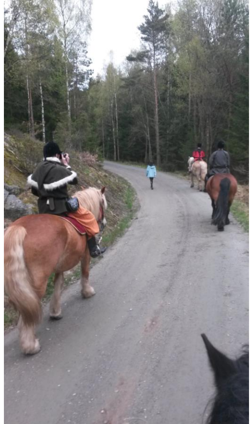
Beléwien (text och bild)

I maj (UT) gav sig fem modiga mithlonditer iväg för att rida på ardennerhästar. Eskorterade av två guider till fots och en hund bjöd dagen på en tvåtimmarsstur.