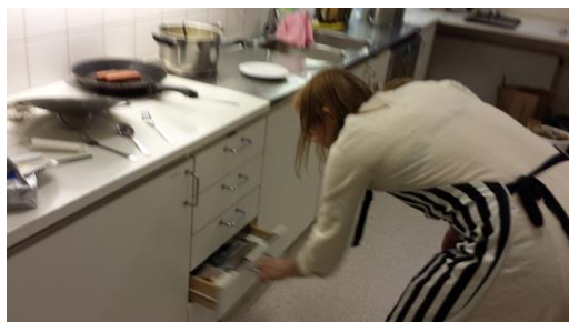
ET avslöjar!

Glórfindel: "Vad är det för kött? Omförpackad olifant? Avslöja köksskandalen!"