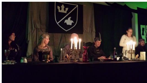
Högbordet efter släckningsarbetet

intelligens. Under de fredsförhandlingar som hölls på lördagen verkade det som om vår regent Narlome råkade bli av med riket... Den överdådiga banketten inleddes med en oplanerad brand på högbordet, nära draken.