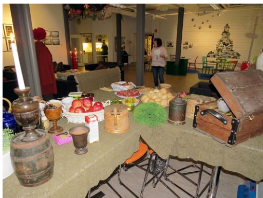
Hobbitbordet