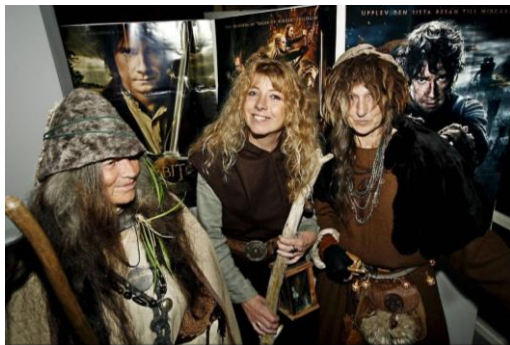
De sjungande häxorna

med TTS i förbifarten. Där fanns flera besökare som hade klätt ut sig och tre utsökt utstyrda häxor, som sjöng vad jag uppfattade som medeltida, eller efterliknade dylika, visor. Vackert!