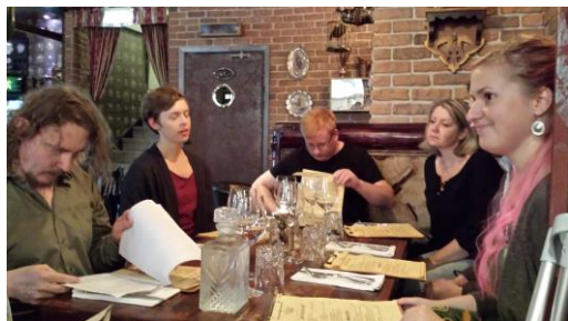
Välsmakande på Steampunkbaren

Septembers riksmöte firades i SF-bokhandelns lokaler med personalens boktips (och Vardamirs ande svävande under takbjälkarna) samt därefter med öl på Steampunkbaren.