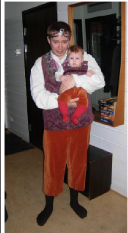
Regenten tog med en egen stjärna till riksmötet om stjärnor