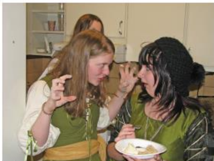
Två bilder säger mer än 2000 ord.