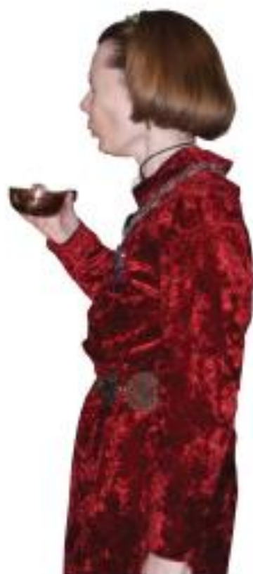
En besk medicin utlovas Mithlonds fiender vid angrepp!