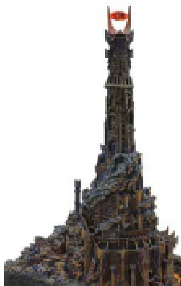
Barad-Dûr - We cater Your every need....

S: Vi tittar på flera olika expansionsscenarioer. Helst skulle vi ju gärna besätta hela området från Mordor upp till Mithlond men som den ekonomiska situationen ser ut idag har vi helt enkelt inte de resurser och den personal som krävs för en sådan vidsträckt ockupation. Det mest aktuella just nu är därför Gondor. Gondor är en stark konkurrent på det lokala planet