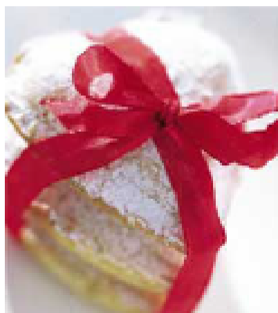
"Have a cookie, its on me" - Sauron

Sauron tar ett vaniljhjärta och tuggar eftertänksamt på det medan hans publicist visar upp ett (falskt) kontrakt som påtalar regelbrottet.