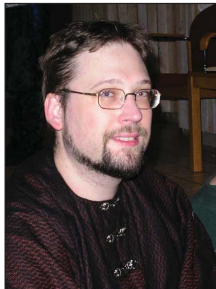
Bokgilletts mystiske ledare