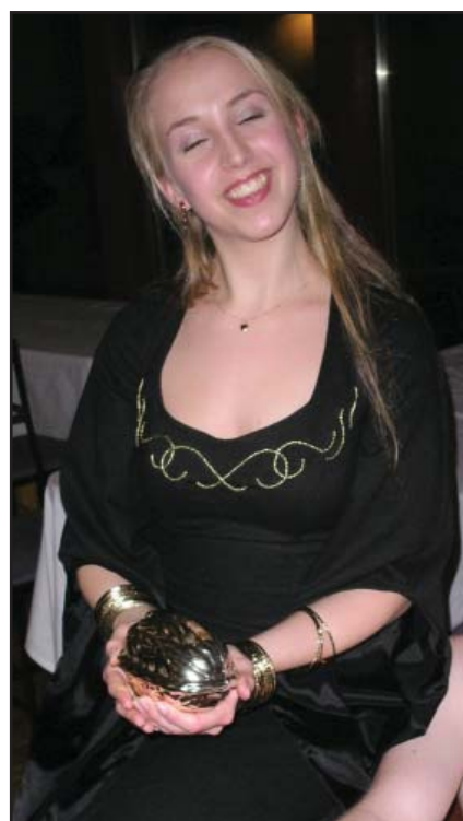
Stolt vinnare visar pris