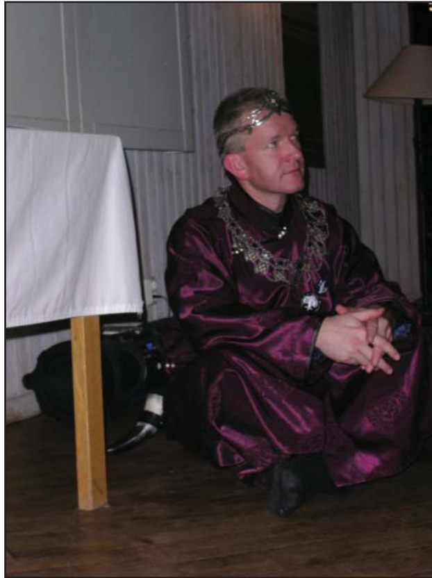
Artikelförfattaren på TF

jämfört med 350 kr för en helg med två övernattnings. Att Mithlond kan hålla så pass låga priser hänger ju ihop med att vi inte har löpande lokalkostnader.