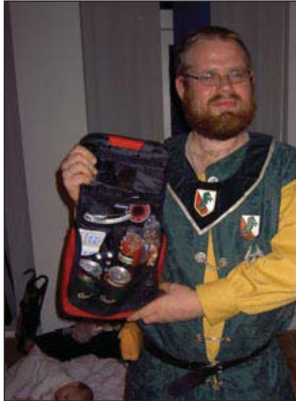
Pippin mottar Mithlonds ambasadgåva

kändes solen ännu behagligare. Att vägen dit hette rolighetsvägen (fritt översatt) gjorde ju inte förväntningarna lägre. Finrod mötte i dörren och sa att de fortfarande håller på att sätta upp bankettlokalen, men att baren redan hade öppnat, inget som förvånade mig på en fest i Bri.