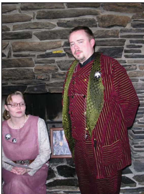
Hovpoet i författaresk pose