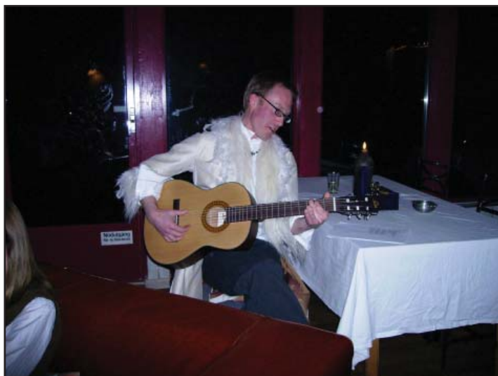
Underhållning i baren på TF