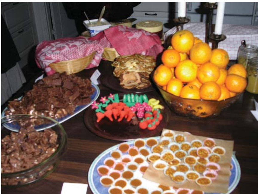
Matgilletts prestationer på Julbokgillet

att lyckas med det), skalande, kokande, gratinerane o.s.v. kunde vi så sätta oss ner och njuta av “Rotsellerisoppa med apelsin och saffran” (fast i vår version lagade vi denna utan saffran), “Vegetarisk pastagrätäng”, “Fetafylld paprika”, “Päron med brie och pekannötter”