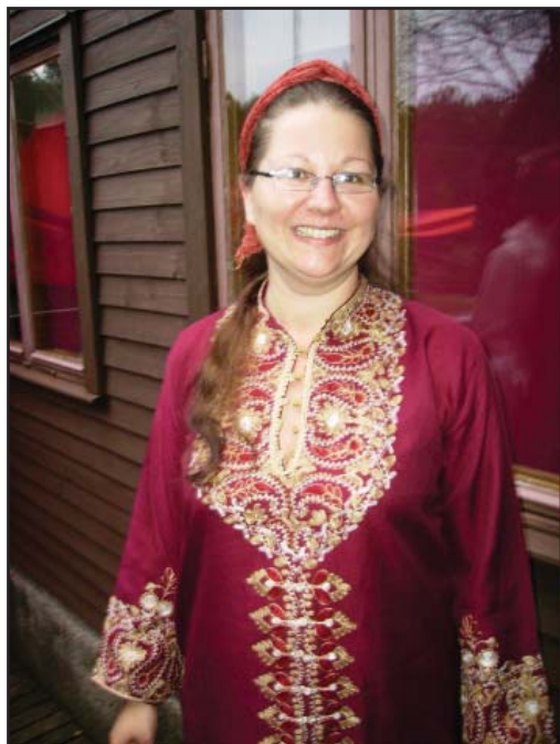
Lycklig mottagare av konkarsten

jag förmaningen om att jag hade brustit i min uppmärksamhet. Jag fick veta att det var dags att återuppväcka en gammal tradition som legat slumrande en tid. Det var dags att på nytt utse bärare av MMM's storslagna orden. Konkarstenar skulle delas ut.