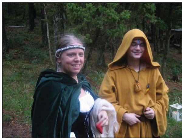
Trollkarlens författare (tv)

Genom ett fönster med galler så såg hon in i en liten, sparsamt möblerad