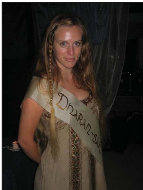
Gillesmästarinna besöker HG