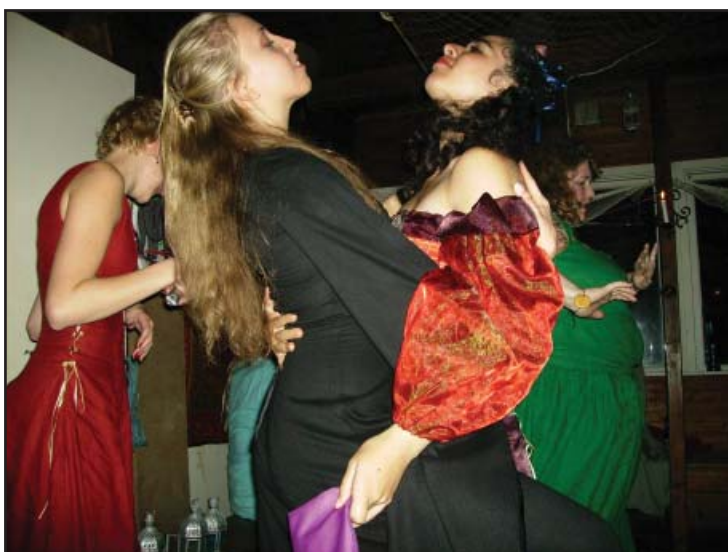
Husmor instruerar sina pager