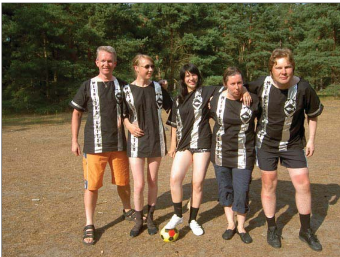
Mithlond United försvarar sina färger