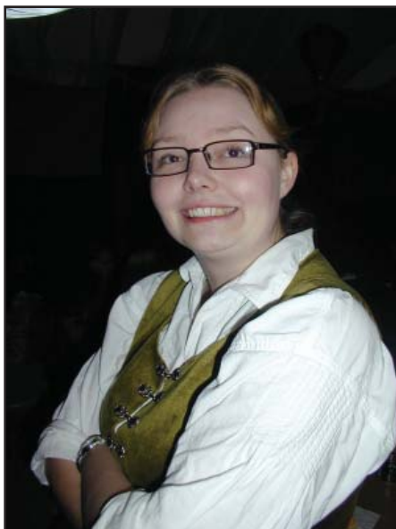
Lycklig förnyare av konkarsten

Till den undersköna Dam Thengwyn ger vi en sammetspåse fylld av bekräftelse. Vi mottager dagligen bevis på att vi har allierade även bland de vilseledda