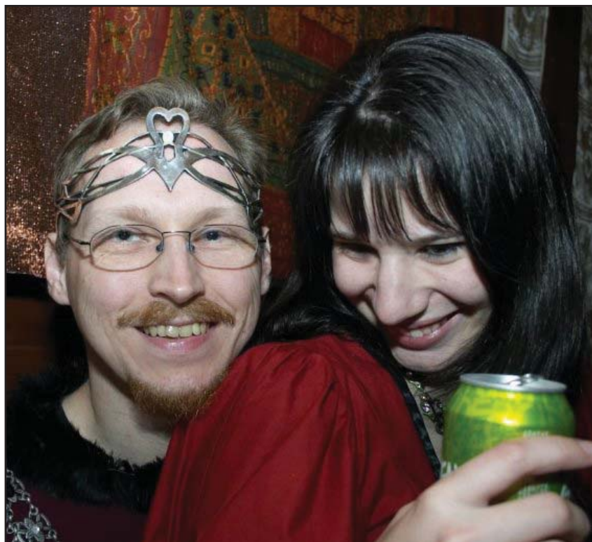
Uppsluppen regent med misse på sistlidna höstgillet