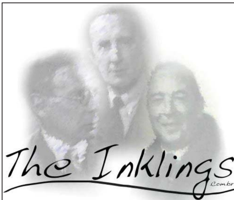
The Chief Inkling Gang — Dyson, Tolkien, Lewis

Båda två hade redan börjat skriva när de lärde känna varandra, men de insåg att det fanns ett hål som de kunde fylla.