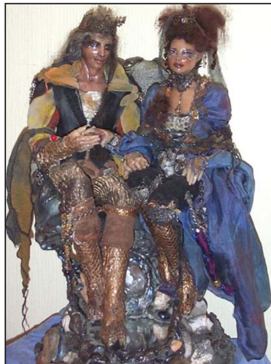
Beren & Luthien

Följande år ägnade Tolkien helt åt skolan och studier. Han studerade språk, språk och åter språk. Men hans pluggande gav resultat, och denna gång accepterades han in på Oxford. Och där vet vi vad som följer, Inklings och en mängd skrivande, och, tillslut, giftermål med Edith, som han längtat så länge efter.