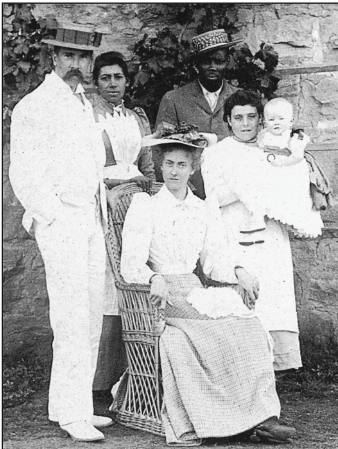
Hela familjen Tolkien med tjänstefolk i Sydafrika

Hösten 1899 började Tolkien på King Edwards i Birmingham. Mabel flyttade därför med pojkarna in till Birmingham, och de glada lantliga dagarna var till ända. Mabel var dock inte nöjd med deras boende. Efter mycket sökande hittade hon Birmingham Oratory. Inte