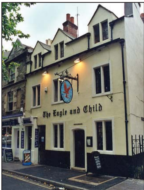
The Eagle And Child (”Bird and Baby”)

I am afraid we shall have to try and write some ourself”. De kom överens om att Tolkien skulle skriva om tidsresor och Lewis om rymdresor. Tolkien påbörjade ”The lost road”, en bok som han inte kom så långt med – men stora delar återanvändes senare till historien om Numenor.