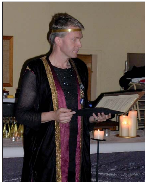
Konsten att skapa uppmärksamhet...

80% av gycklen brukar vara anmälda och 20% kommer till under eller