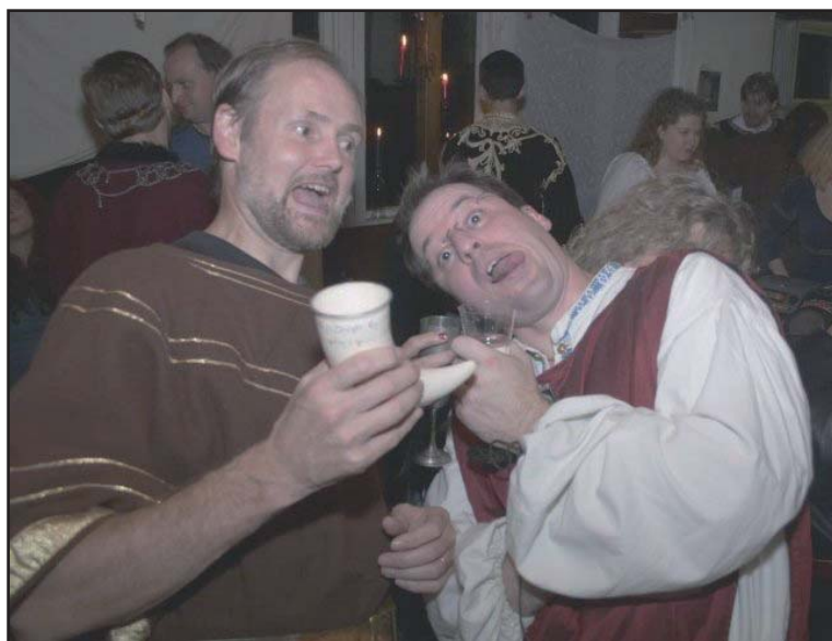
Skålordning för Furstar och Jarlar?

Angmar och Mithlond tillämpar inte skålordningsregler, men det kan ändå vara trevligt att svarsskåla inom 5 minuter.