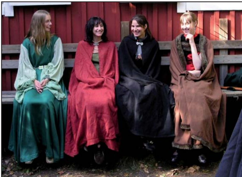
Det goa gänget... där varelser av olika natur umgås och ler.