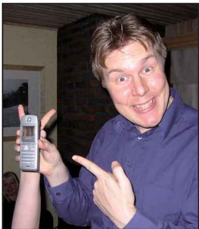
Så här glad blir man när man bestämt temat för kommande Elostrion.