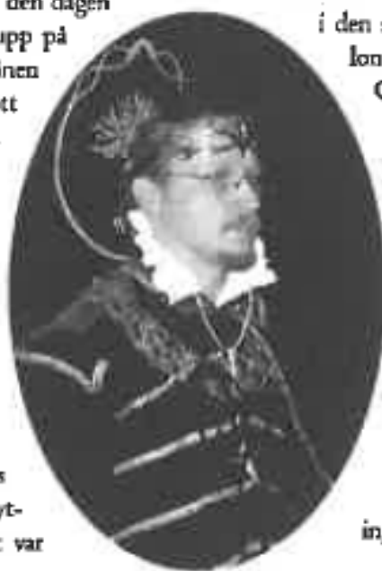
Mithlonds Regent, Kung Turgon, nykrönt och i sin nya krona, vilken smiddes av Aezuar av Angmar.

FOLKJET JOBLADE. Pris ske Kung Turgon, vår Regent! Eglerio! Och glädjen var stor. Härefter kunde festen taga sin begynnelsen, att fira inte enbart det nya året, utan även det att Regenten till slut hade krönts.