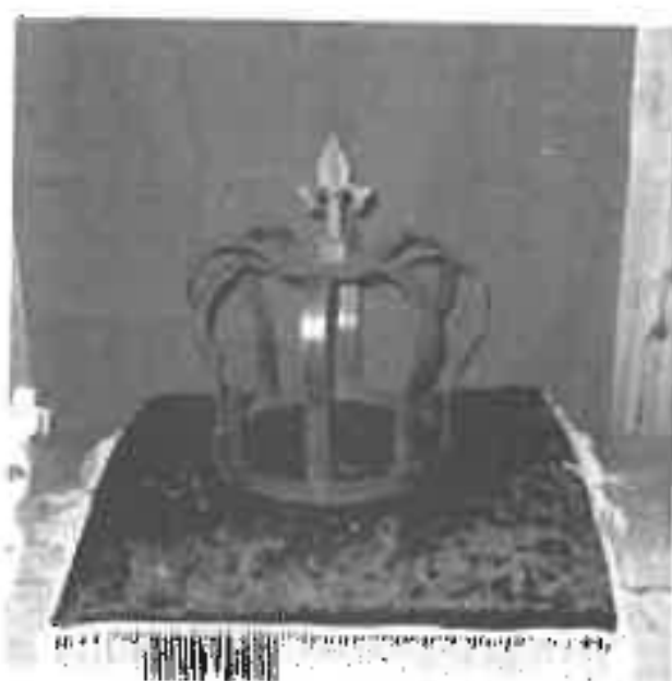
Ambassadgåva: Angmars järnkrona.

sagolikt god middag (inledd med Fefés Special - tunnbrödsrullar med "hemligt" innehåll - grönkålssoppa med tillhörande ägghalvor, följt av en bastant huvudrätt bestående av oxfilé, klyftpotatis, sallad och sås, vilket avrundas med hela två efterrätter där sinnen villigt låter sig trollbindas av Vanimeldés chokladkaka och hallonsorbet, och smaklökarna sig smekas ac Scathas vita chokladmousse. Alltihop sammantaget utgör en upplevelse av sådana mått att till