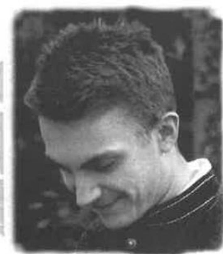
Gil-galad Ereinion, Elostirions grundare

TRE NUMMER AV ELOSTIRION kom att publiceras under signaturen Gil-galad, varefter han överlämnade sitt redaktionella arbete till Häxmästaren, vilken för några år därefter skulle verka såsom redaktör för tidningen, och efter honom kom