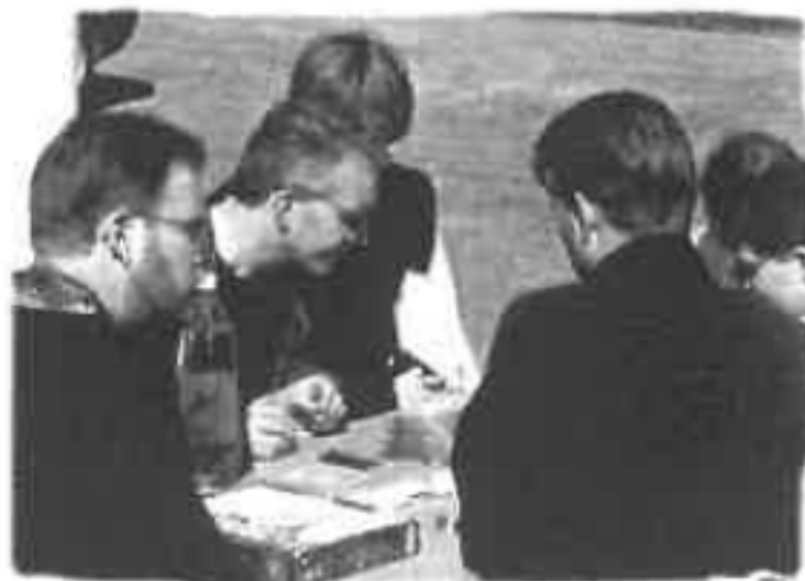
Har har man på lördag förmiddag samlats för ett parti TP..

CEREMONIERNA ÄR SED, och om än något försenade, äger de till slut rum. Ghân-burighân och Elemmacil gör båda spektakulära framträdanden under respektive dubbningssceremoni och utöver Mithlond, håller sällskapet Caras Galadhon och Cerin Erain ambassad, och hela ceremoniblocket avslutas med furst Berts nedstigande från rådet, sedan Akhûrahil och Kheldars uppstigande i sina ämbeten som nya furstar i Forodrims