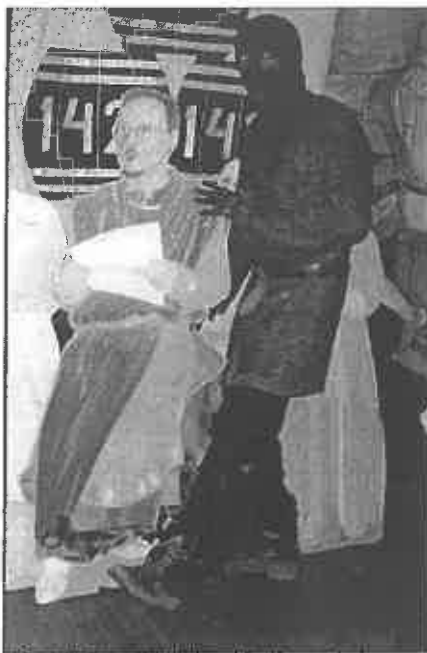
"Det är fint att Mithlond fortfarande har en kvinna som regent."

Likväl är varken mat eller våld det enda som under denna Ringarebankett förmår att underhålla gästerna, ty här förekommer även sång (Mellonath Gleowine framför ytterligare nummer, där Forodrim's ceremonimästare Ingwë hyllas på ett minst sagt speciellt sätt, och Cirieth framför solo sin