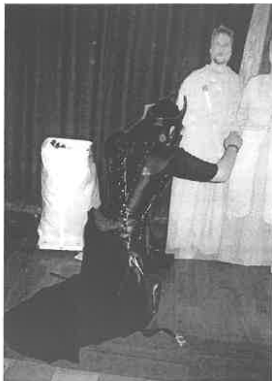
"All shall love him and despair!"

Sedan sprider Serog skräck på damtoaletten, och Ruby dokumenterar glatt och käckt hur Cirieth vördar Vardamir mer än någonsin, alltmedan Grishnákh blir närgången med Turgon på ett sätt som både upprör och chockerar, men framför allt underhåller!