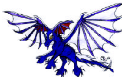
"Stormcrow and Pilgrim"

Jaha hade man slängt bort pengarna eller ej det var frågan, och döm av min förvåning när jag hade lyssnat igenom den en gång. Den var ju sketabra! Den är fylld med rock musik med en touch av symfoniorkester med stråkar och körsång, och texterna är klart inspirerade av Sagan om Ringen och har en bra berättande story i låtar som t.ex. "The wraith of the rings", "The fellowship" och