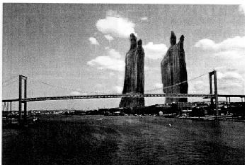
Fotomontage av Peter Wetteus