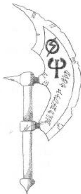
Tecknad av Isengrim III