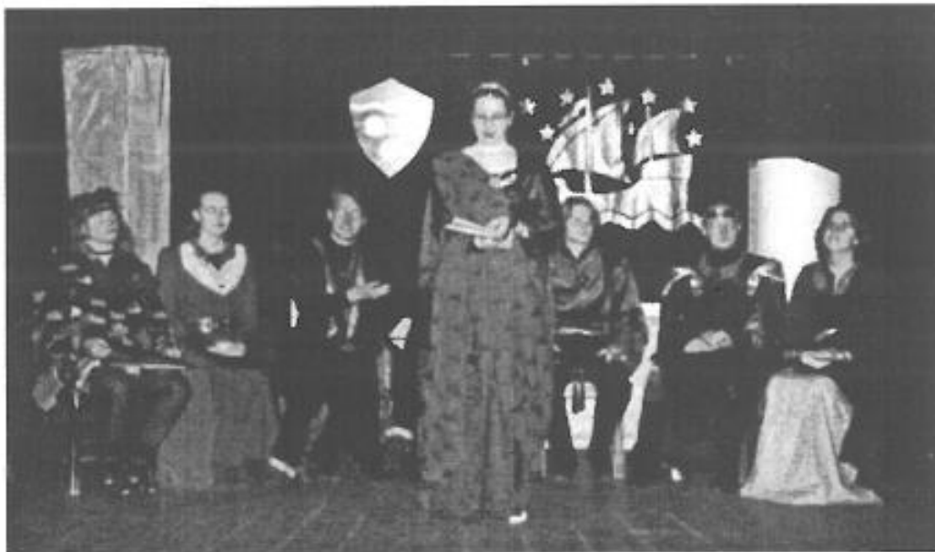
Nyårsfesten i Gårdhalla. Grendel Regina håller hov medan hennes nyatillträdde Råd vördnadsfullt lyssnar eller lystet gestikulerar... (Välj själv.)