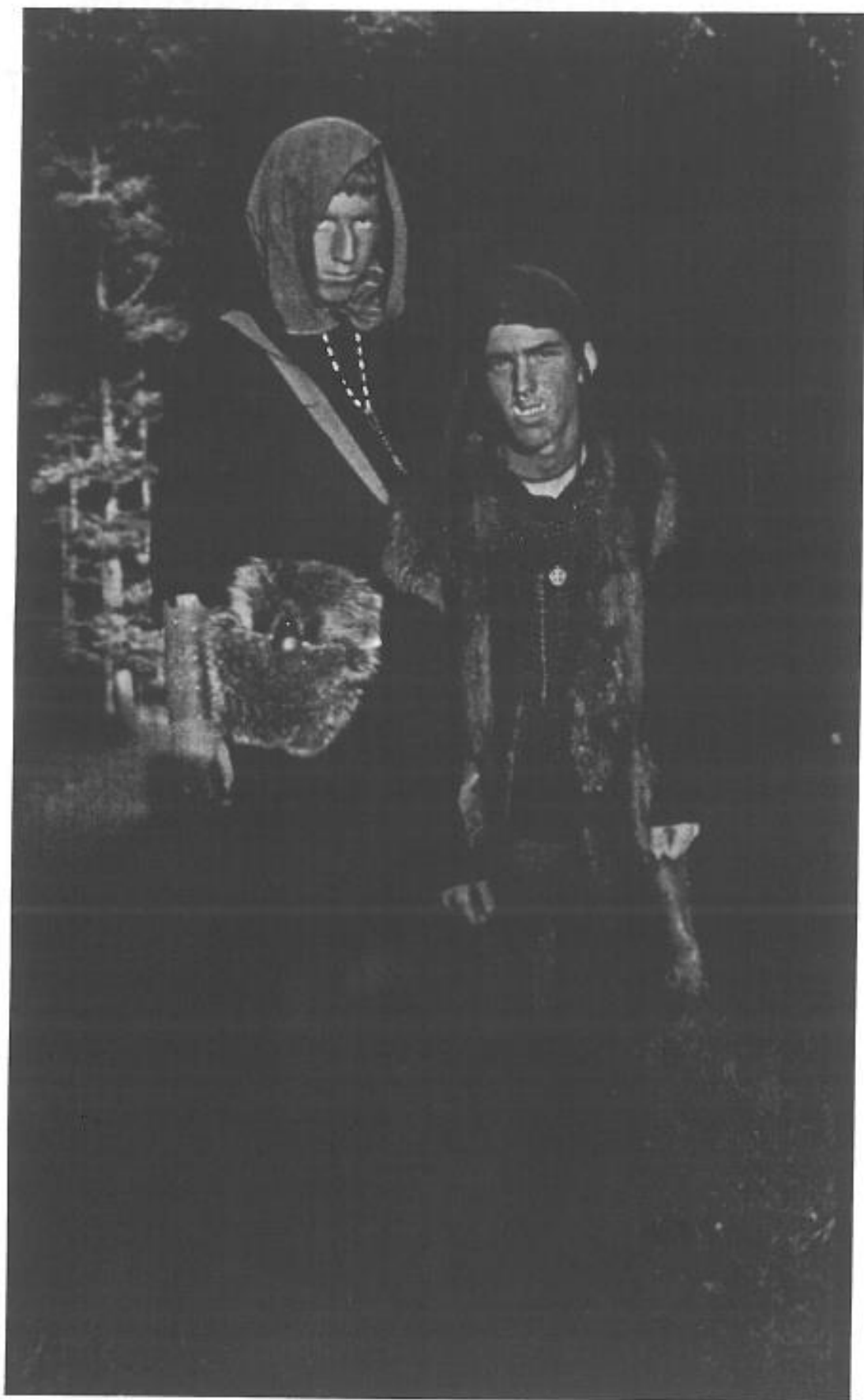
Tvenne orcher i Beokskeogen. Bilddemonstämjare: Alfirin.