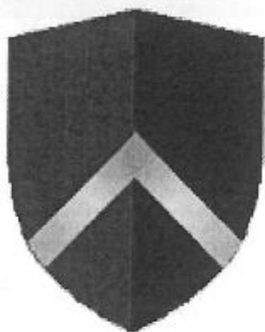
Riddar Iorlas vapen.