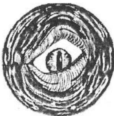
Iorlas, Gillesmästare Mellonath Elbereth

För att hjälpa dessa sargade själar tänker Mellonath Elbereth under några av höstens spelkvällar anordna lättare läs- och skrivkurser, med titlar såsom; korta ord som börjar på q, längre ord som slutar på z, vårt reciproka pronomen, samt hur man avslutar en redan lång mening med en avslutning som gör den läsbar även för den som inte riktigt fattade att den började redan flera rader ovanför det att den slutade.