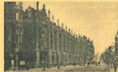
King Edward's School

"Ronald enjoyed his schooldays at King Edward's [Reds anm: i Birmingham]. He was good at games, especially rugby, being made captain of the rygby team from 1910 to 1911. He was also active in the Debating Society. The backbone of the curriculum was Classics.