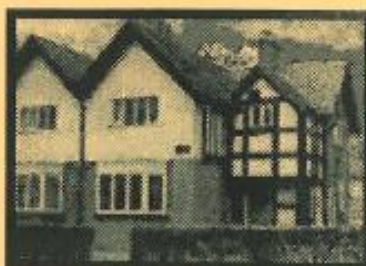
264 Wake Green Road

Tolkien sa ofta att de lyckligaste åren av hans barndom var när de bodde i Sarehole. Hans mor flyttade dit kort efter att huset byggdes, 1896, när det var känt som 5 Gracewell. Den lilla byn Sarehole anses allmänt ha varit förebild för, the Shire, hobernas hem.